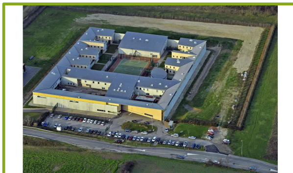
PRESENTATION POPULATION : EPM